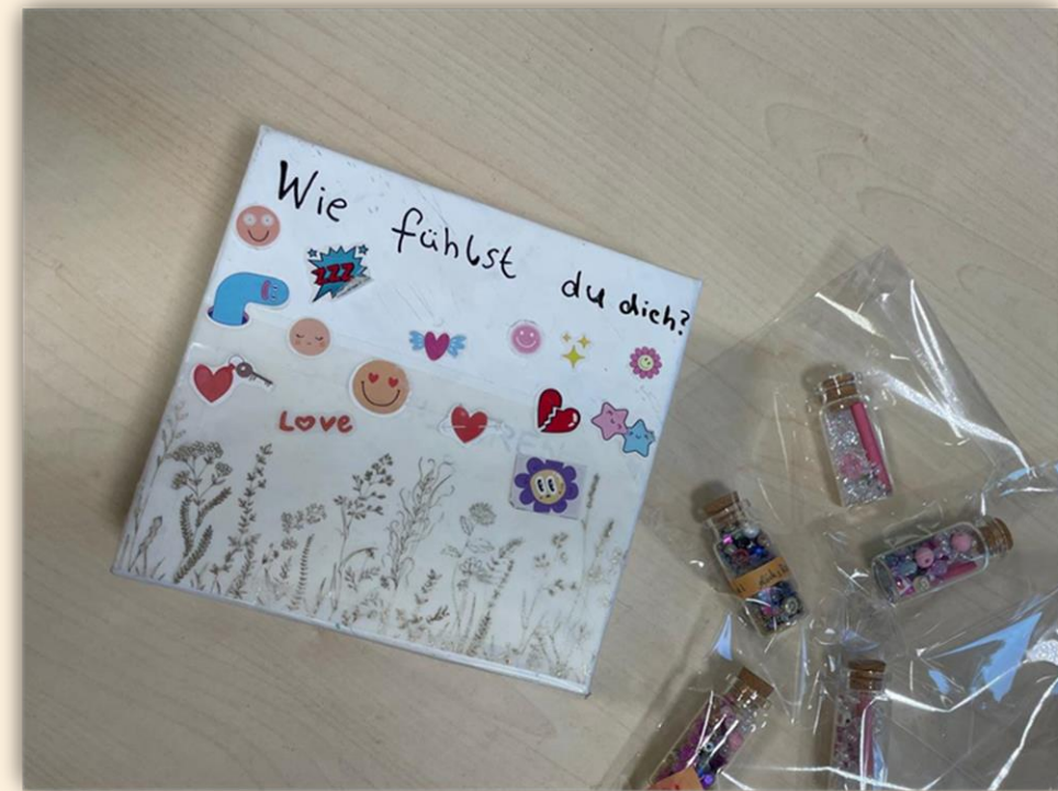
Einblicke der einzelnen Angebote