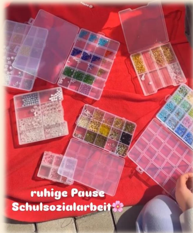
ruhige Pause Schulsozialarbeit